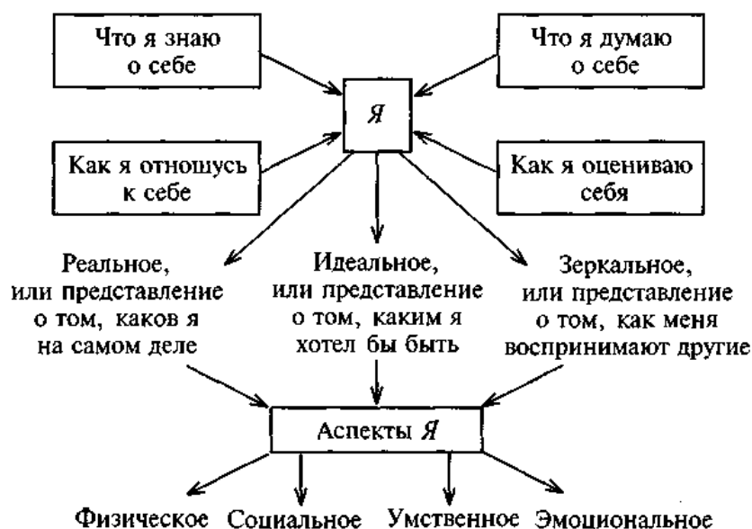
Рис. 2. Структура Я-концепции

ее характерные особенности. Схематически структуру Я-концепции можно изобразить следующим образом (рис. 2):