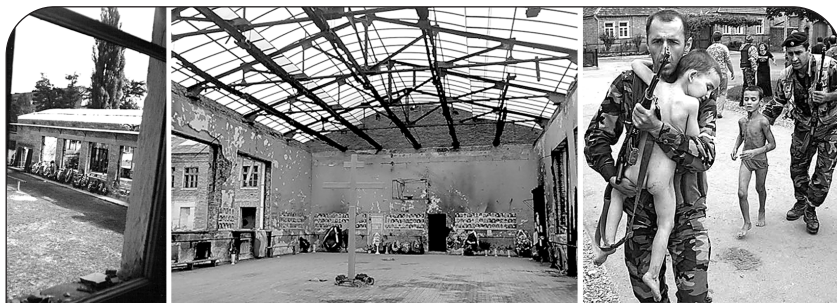
Из этого окна пулемет террористов поливал свинцом детей, разбежавшихся после взрыва в спортзале.

Но именно это и нужно было террористам: чем больше ужаса, тем легче добиться своего. Они знали, что за стенами школы мечутся обезумевшие от горя родственники заложников. Они видели из окон, что отцы захваченных детей рвутся к оружию. Все это воздействовало на власти, заставляло их лихорадочно искать выход из ситуации. Ведь власти понимали, что они не должны принимать условия террористов. Но еще лучше они понимали, что не имеют права допустить гибели заложников!